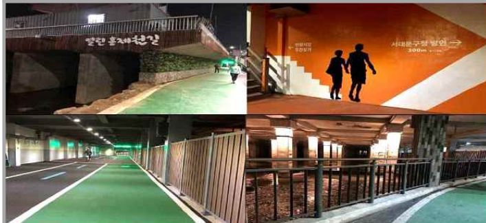
< 열린 홍제천길 개통 후 >